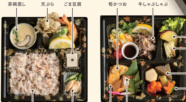
十穀米ごはん ささみと胡瓜の梅和え